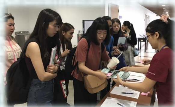
與會者報到，領取講義及資料