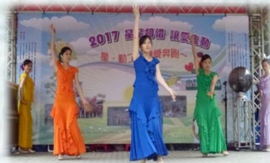
士林社大專業的佛朗明哥舞蹈演出