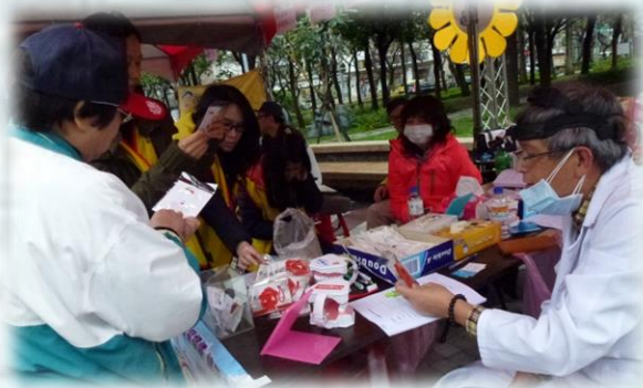
提供自閉症者牙齒檢查的服務