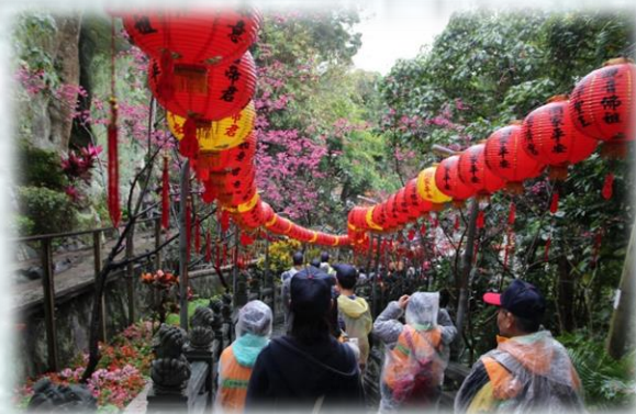
健走的當下，享受與大自然親近的時刻，身心舒暢