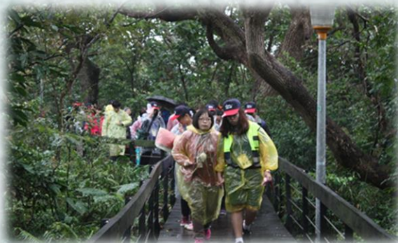
在輔導人員陪同下，星兒 即將走到山頂