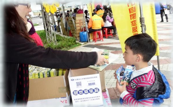
和民眾宣導互動情形