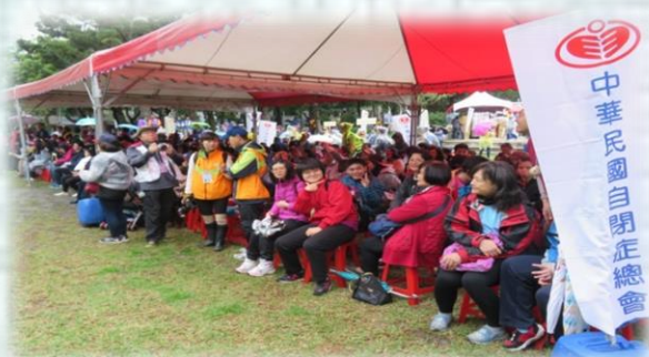
現場滿滿的都是在觀賞舞台表演節目的民眾和自閉症者