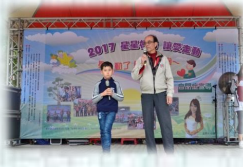
唱功一流的星兒與爺爺同臺高歌，帶來經典的台語歌曲