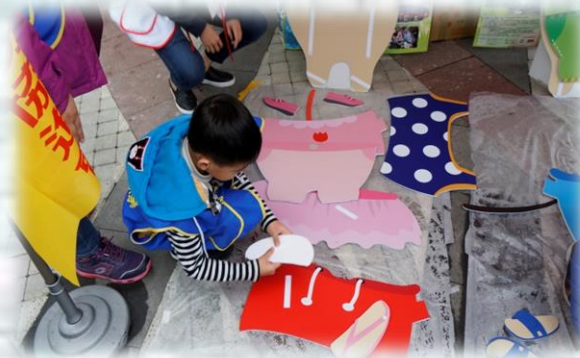
自閉症者及社會大眾參與宣導攤位活動