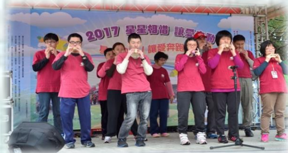
星兒工坊帶來精彩陶笛演出