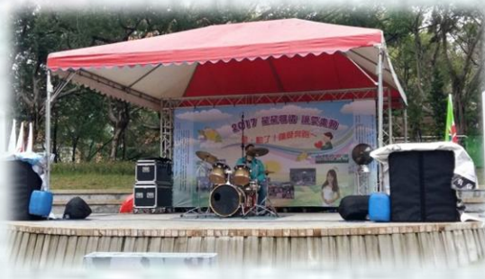
星兒藝人小官讓人驚艷的爵士鼓表演