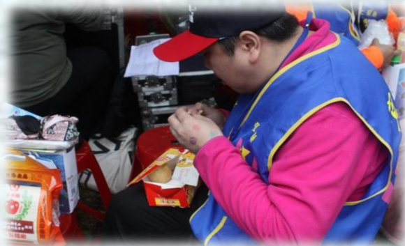
參賽者開心領取完賽禮，開始大快朵頤補充體力