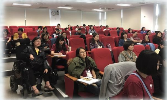
參與者認真聆聽講師的分享