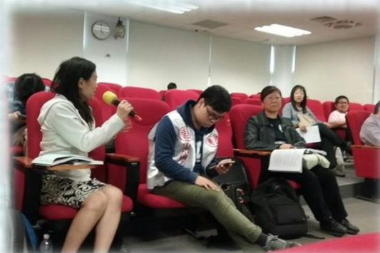
參與者提問並與講師互動