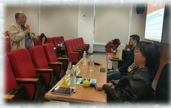
綜合座談參與者踴躍提問