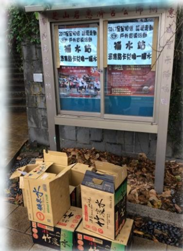
沿途設置補水站， 給星兒滿滿的活力