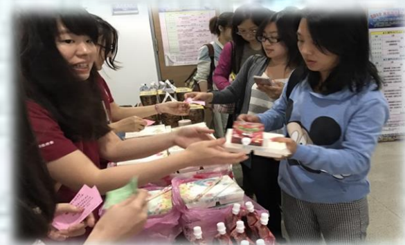
用餐囉！吃飽在繼續聽講