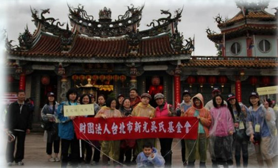
抵達惠濟宮！來拍個大合照紀念一下