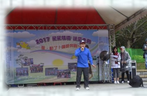
星兒大使小淳的歌唱表演