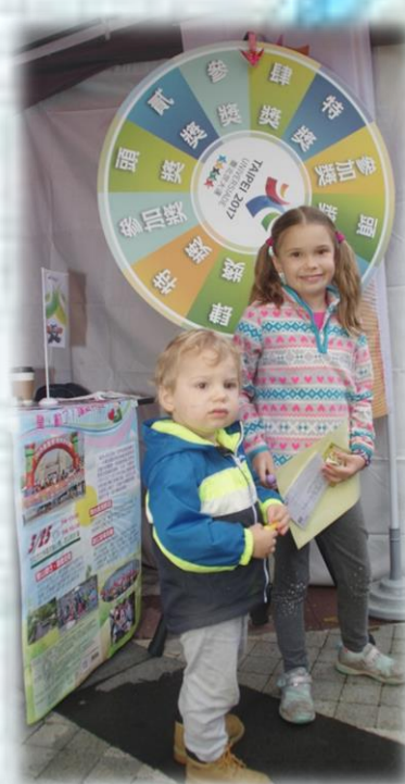
社區民眾共同參與世大運的宣導活動