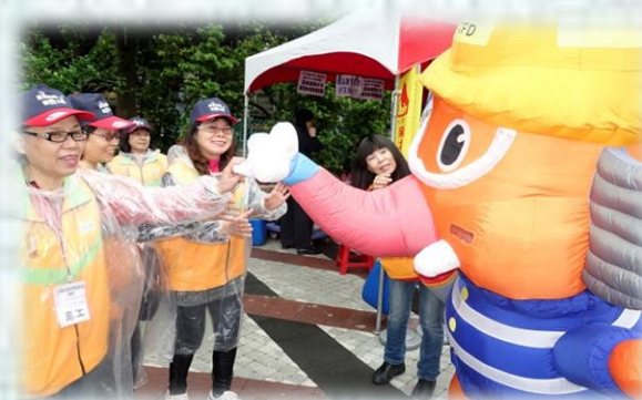
現場有許多大型玩偶，吸引星兒及民眾互動合照，大家都很开心😊