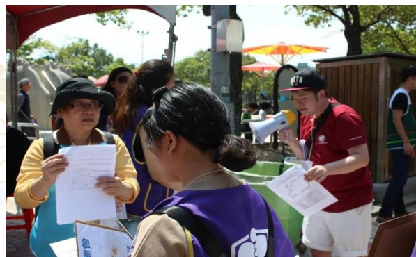
大家注意聽好，準備上工囉！