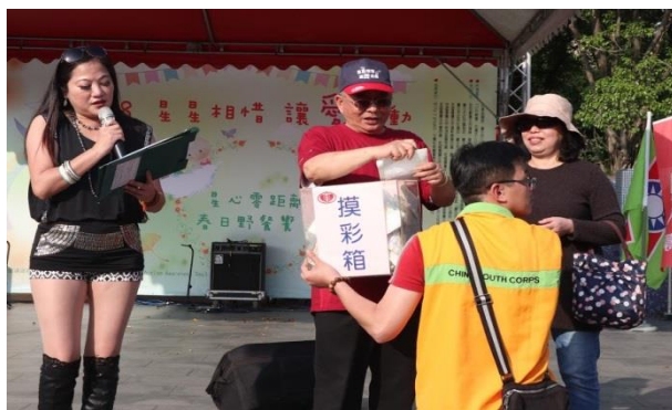
大家最期待的摸彩活動來囉～