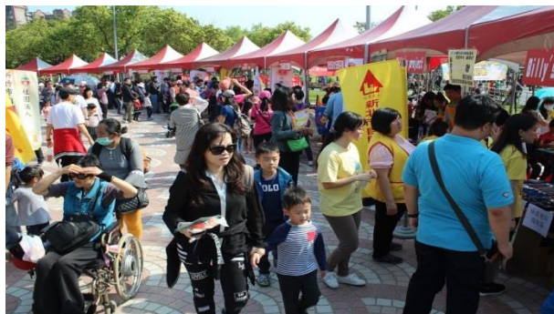
現場人潮絡繹不絕