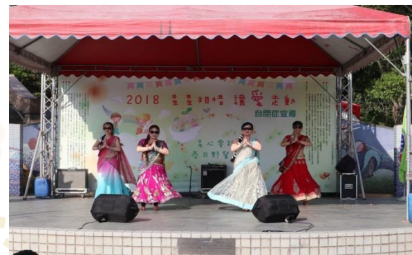
充滿異國風情的曼妙舞姿