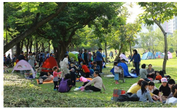
伴隨著歡笑與美食，留下一個難忘的回憶。