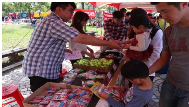
交通局有好多贈品喔～