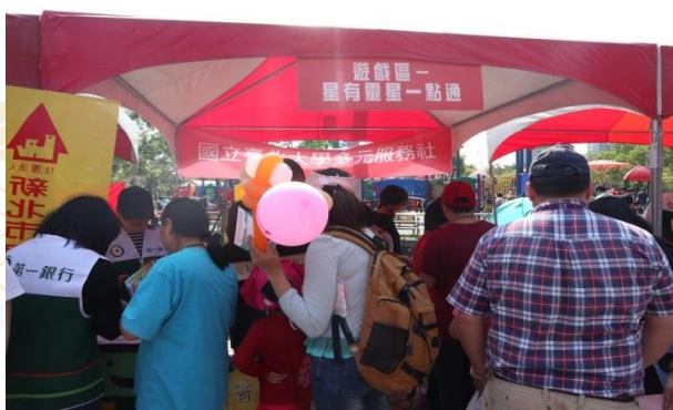
大家都好熱烈參與活動呢！