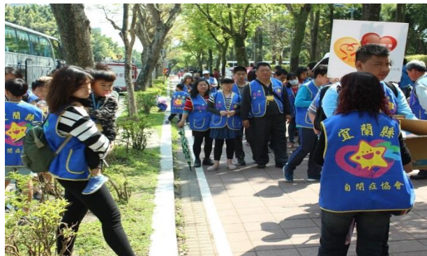
來自各地的朋友們陸續抵達