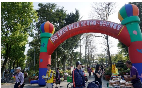
活動拱門(公園2號出口)