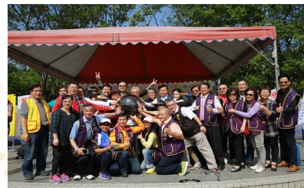
開幕儀式 點亮LED燈球