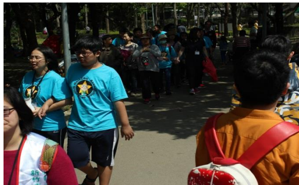
好期待今天的活動呀！