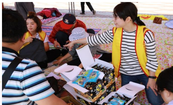
想吃點東西，小小一包方便又可口。