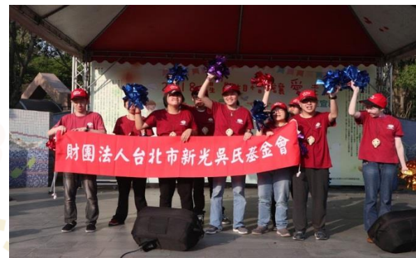
最後，由星兒特攻隊帶來活力滿分的舞蹈與陶笛演出，畫下完美的句點