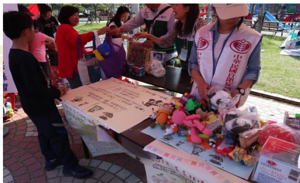
二手玩具交換 學習愛物惜福