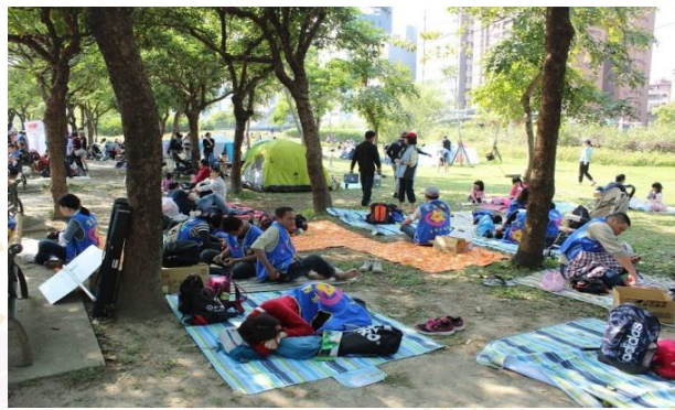
茂盛的枝葉提供了溫柔的保護