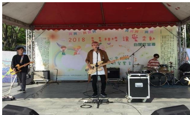
FLUX樂團首先帶來一連串動感歌曲