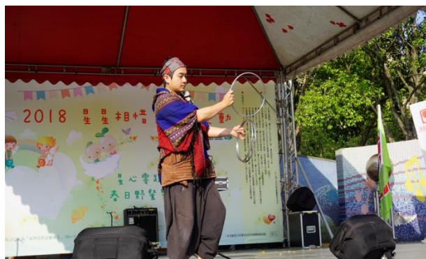
阿凡達的奇幻魔術秀