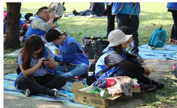
而在一旁的草地上也充滿人群