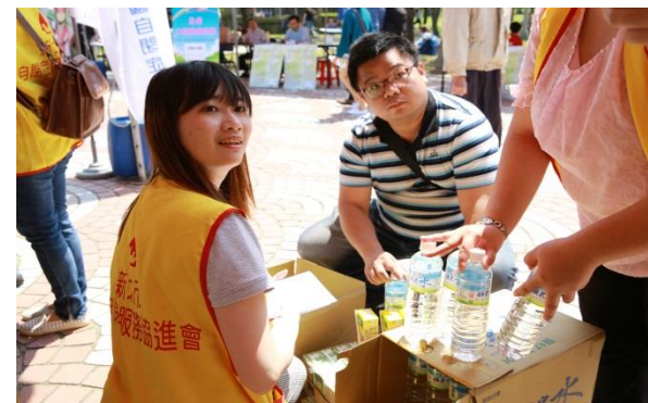
水分的補充是很重要的