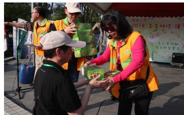
一次拿到一整包海苔，太開心啦！