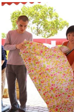
一起把剛拿到的野餐墊鋪好