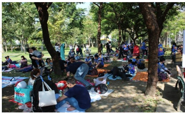
把熱烈的艷陽變得和煦