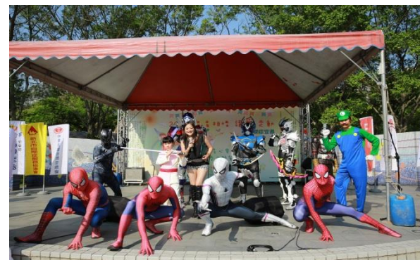
送養者聯盟驚艷全場的COSPLAY