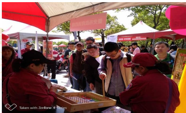
來消防局攤位打彈珠～真好玩