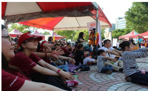
舞台表演令人看得目不轉睛