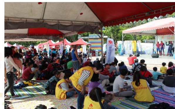
佈置完畢，大功告成～！