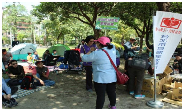
領取物資請跟我來