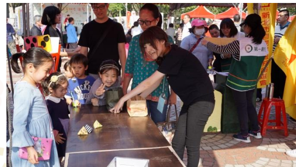
孩子們純真的笑容，就是最棒的禮物！