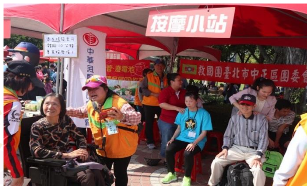
你累了嗎？歡迎光臨按摩小站。