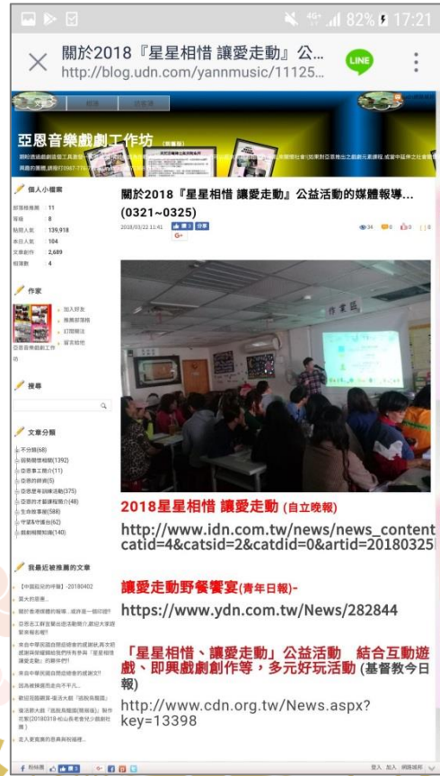
亞恩音樂戲劇工作坊