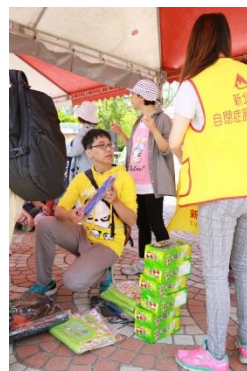
志工忙著整理剛拿到的物資