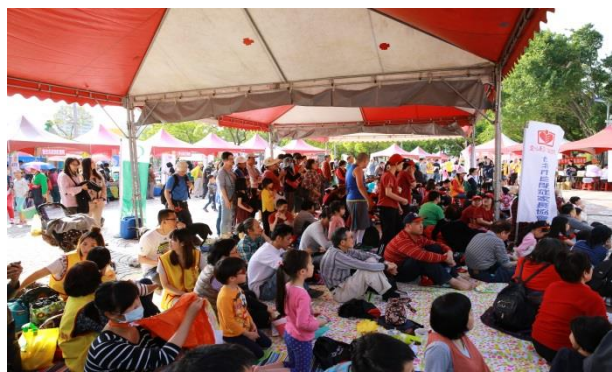
越來越多人聚集在舞台前