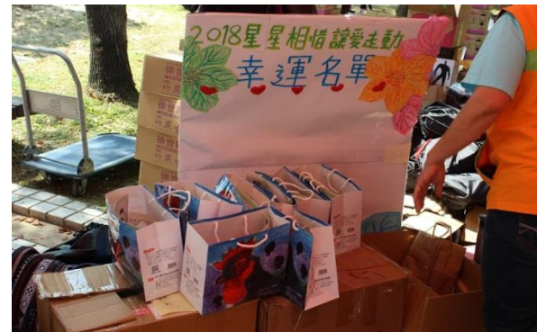
用心包裝每一份禮物