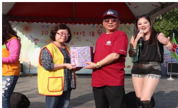
能拿到郭昭巖議員的禮物，實在太幸運了。