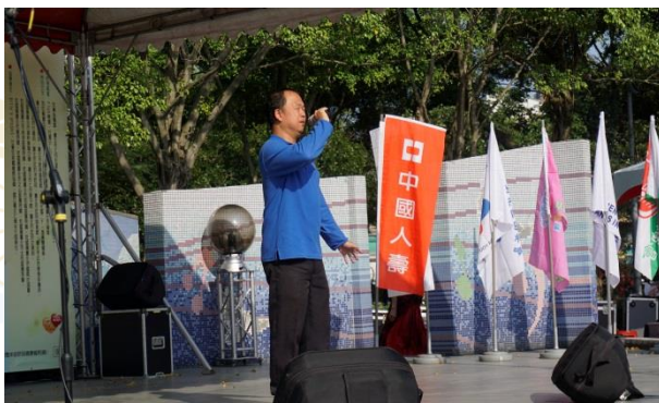
星兒大使小淳用歌聲打動人心