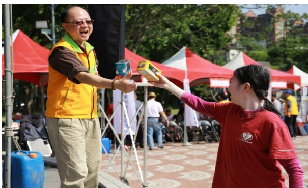
有獎徵答時間 禮物大放送