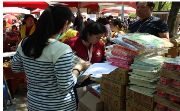
一起同心協力清點及分配