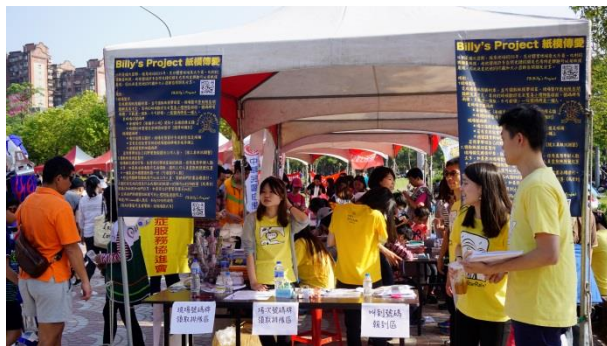
好玩有趣的免費紙模DIY