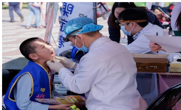
牙醫師公會提供免費的口腔檢查