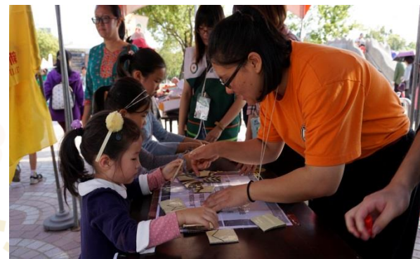
一起動動腦、拼拼圖