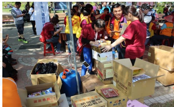
滿滿的補給品都在這裡！