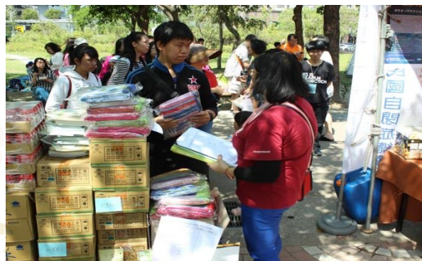
拿到好多東西，真開心～