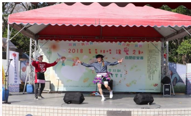
結合傳統與現代的原住民舞蹈