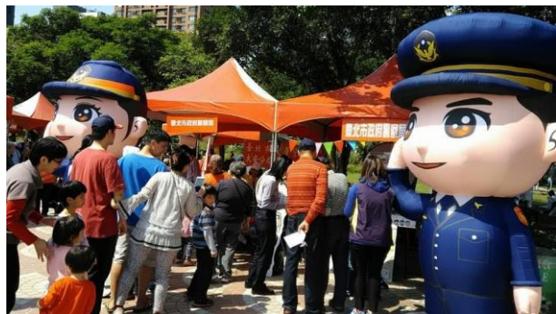
可愛的警察娃娃馬上吸引全場目光