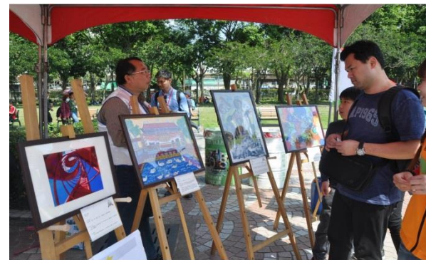
來自星兒們的繪畫及攝影作品